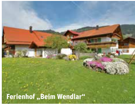
Ferienhof „Beim Wendlar“

Bei Bauernhofbesichtigungen, können die Kinder mal beim melken, beim Kälber tränken, beim Schweine füttern, beim Mähen oder bei der Heuernte zuschauen oder gar mit Hand anlegen.